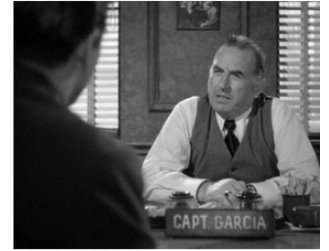
1950 DU SANG SUR LE TAPIS VERT (Backfire) de Vincent Sherman avec Edmond O'Brien