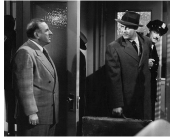
1949 IT HAPPENS EVERY SPRING de Lloyd Bacon avec Ray Milland