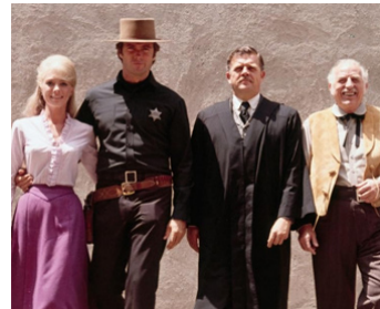
1968 PENDEZ-LES HAUT ET COURT (Han'em High) de T. Post avec I. Stevens, C. Eastwood, P. Hingle