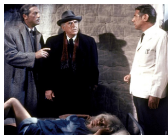
1970 HORREUR À VOLONTÉ (The Dunwich Horror) de D. Haller avec S. Dee, L. Brochner, M. Fox