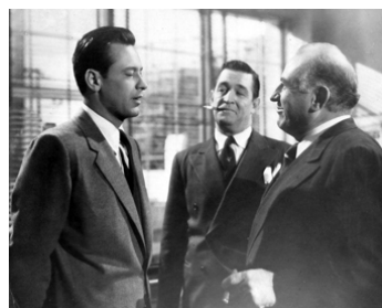
1952 LE CRAN D'ARRÊT (The Turning Point) de William Holden