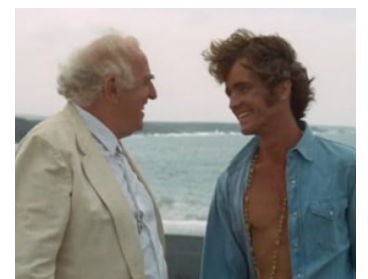
1970 LA ROUTE DE SALINA (Road to Salina) de Georges Lautner avec Robert Walker Jr