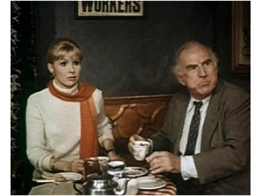
1967 THE VIOLENT ENEMY de Don Sharp avec Susan Hampshire