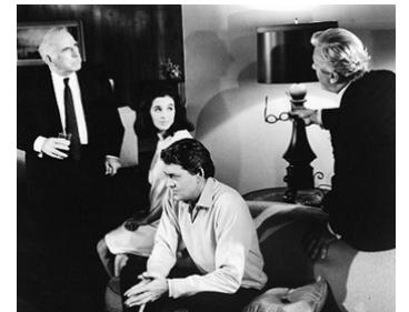
1968 LES TROUPES DE LA COLÈRE (Wild in the Streets) de B. Shear avec M. Perkins, H. Holbrook