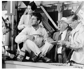
1961 LE CASQUE VERT (The Green Helmet) de M. Forlong avec Nancy Walters, Bill Travers