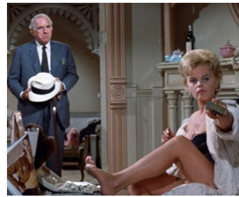
1962 DOUX OISEAU DE JEUNESSE (Sweet Bird of Youth) de R. Brooks avec M. Sherwood