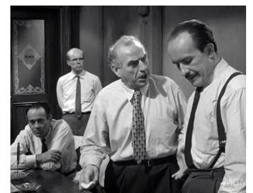
1957 DOUZE HOMMES EN COLÈRE (12 Angry Men) de S. Lumet avec H. Fonda, Jack Warden