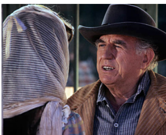
1969 THE SILENT GUN de Michael Caffey avec Susan Howard