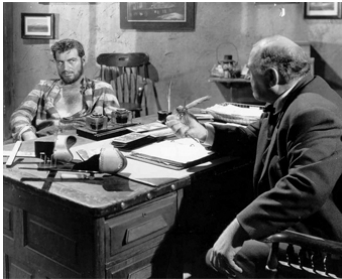
1950 DANGEREUSE MISSION (Wyoming Mail) de Reginald Le Borg avec Stephen McNally