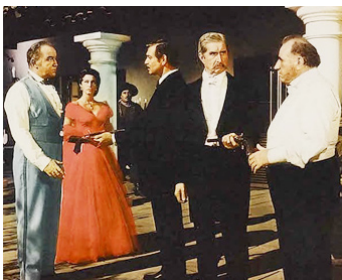
1952 L'ÉTOILE DU DESTIN (The Lone Star) de V. Sherman avec B. Crawford, A. Gardner, C. Gable