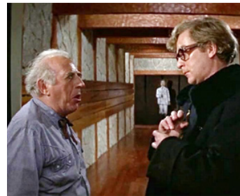
1967 UN CERVEAU D'UN MILLIARD DE DOLLARS (Billion Dollar Brain) de K. Russell avec M. Caine