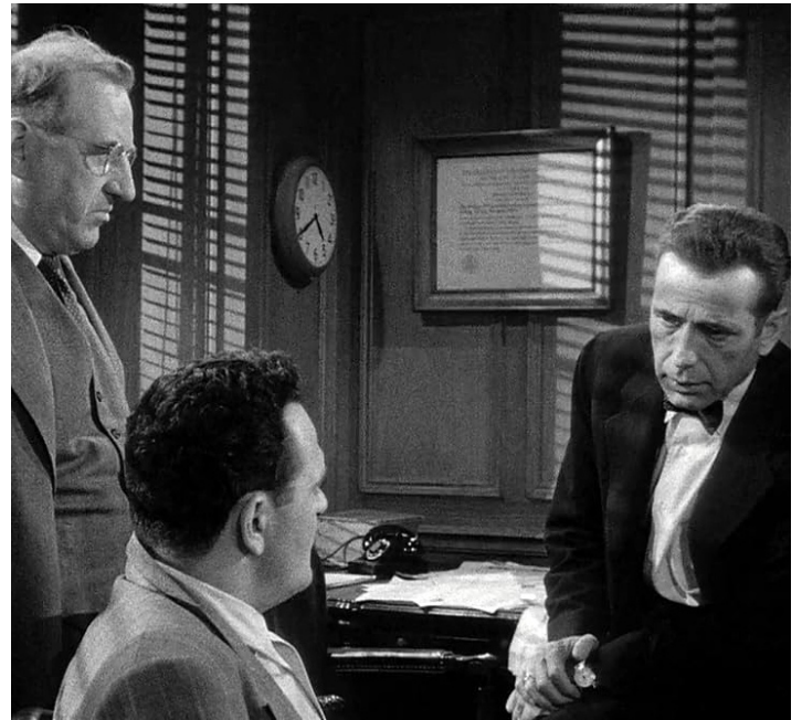
1952 BAS LES MASQUES (Deadline USA) de Richard Brooks avec Joe De Santis, Humphrey Bogart