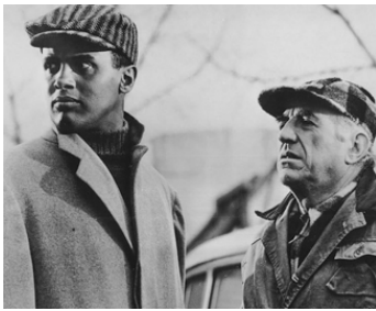
1959 LE COUP DE L'ESCALIER (Odds Against Tomorrow) de R. Wise avec Harry Belafonte