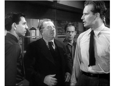
1950 LA MAIN QUI VENGE (Dark City) de William Dieterle avec J. Webb, H. Morgan, Ch. Heston