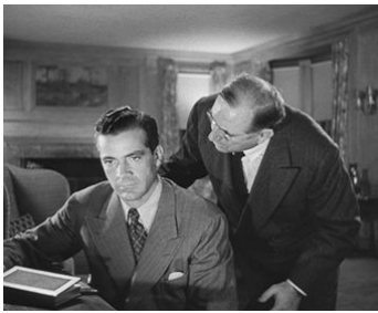
1947 BOOMERANG (Boomerang !) d'Elia Kazan avec Dana Andrews