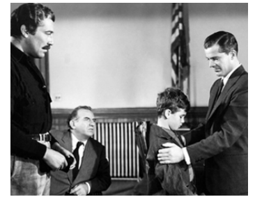
1948 L'ORPHELIN DE LA MER (Deep Waters) d'H. King avec C. Romero, D. Stockwell, D. Andrews