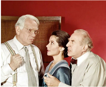
1965 INHERIT THE WIND de George Schaefer avec Melvyn Douglas, Diane Baker