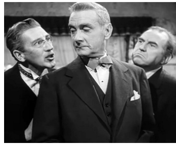
1948 BONNE À TOUT FAIRE (Sitting Pretty) de Walter Lang avec R. Haydn, Clifton Webb