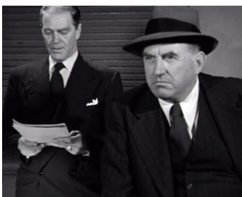
1952 LA MAISON DANS L'OMBRE (On Dangerous Ground) de Nicholas Ray & Ida Lupino