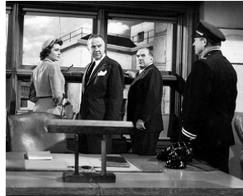
1950 LA LOI DES BAGNARDS (Convicted) d'Henry Levin avec D. Malone, B. Crawford