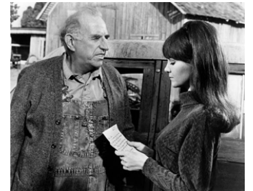
1968 A TIME SO SING d'Alfred Dreyfuss avec Shelley Fabares