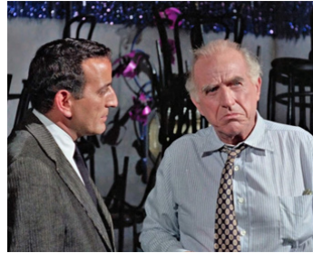
1966 LA STATUE EN OR MASSIF (The Oscar) de Russell Rouse