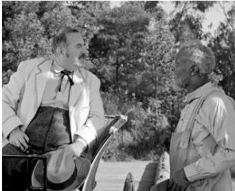
1950 STARS IN MY CROWN de Jacques Tourneur avec Juano Hernandez