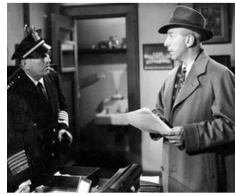
1948 LA DERNIÈRE RAFALE (The Street with no Name) de W. Keighley avec Lloyd Nolan