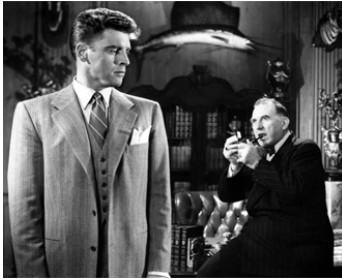
1948 RACCROCHEZ, C'EST UNE ERREUR (Sorry, Wrong Number) d'A. Litvak avec Burt Lancaster