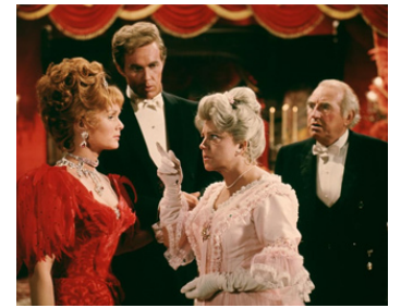
1964 LA REINE DU COLORADO (The Unsinkable Molly Brown) de Ch. Walters avec D. Reynolds