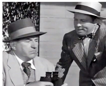
1952 VOCATION SECRÈTE (Boots Malone) de William Dieterle avec Brooks Benedict