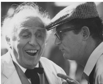
1969 MADAME ET SON FANTÔME (The Ghost & Mrs Muir) de Bruce Bilson avec Charles Nelson Reilly