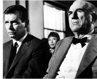
1967 LA NUIT DES ASSASSINS (Warning Shot) de Buzz Kulik avec David Janssen