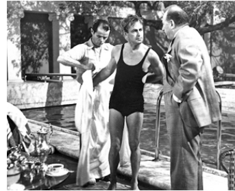
1949 LE PRIX DU SILENCE (The Great Gatsby) d'Elliott Nugent avec E. Cook Jr, Alan Ladd